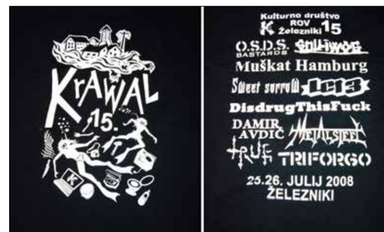
Majica Krawala 2008.