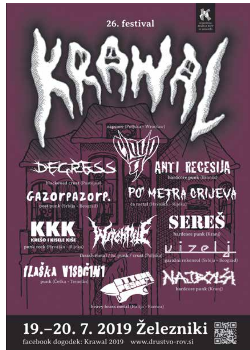
Plakat za Krawal 2019.

Kljub temu da je festival – zaradi višje sile – letos, odkar se je pred 27 leti njegova organizacija začela, prvič – odpadel, upamo, da bo spet zaživel prihodnje leto in omogočil lokalnim in drugim obiskovalcem uživanje v malo drugačni, a kljub temu kvalitetni glasbi.