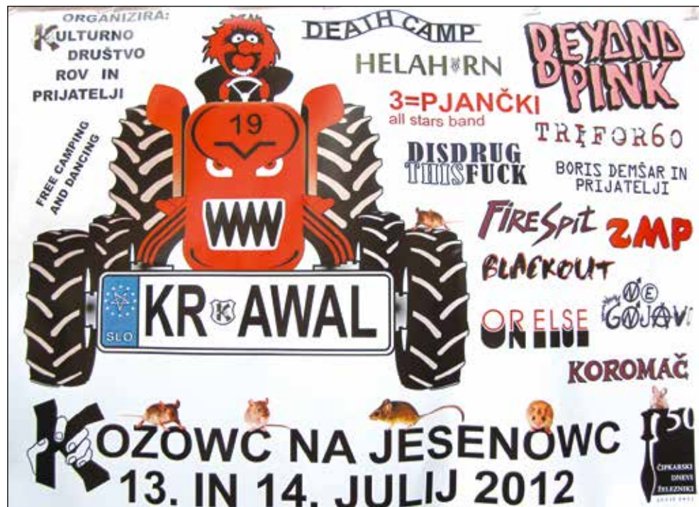
Plakat za Krawal 2012.

V času nastanka festivala so imeli mladi v mislih druženje ob glasbi z drugačno, "za večino ta starih" takrat nesprejemljivo glasbo. Ker je bilo mladih, in še danes jih je takih, ki jim take zvrsti glasbe gredo v uho, veliko, so festival organizirali vsako leto. Za glasbeno vsebino so tako poskrbele domače glasbene skupine in izvajalci, ki jih je bilo v Selški dolini nekdaj veliko, kot tudi glasbene skupine in izvajalci iz drugih koncev Slovenije in celo iz tujine. Če želim na kratko naštet, kakšne zvrsti so bile slišane skozi vsa leta, se bo zagotovo našel kdo, ki je pri festivalu sodeloval tako ali drugače in me oštel, da nisem napisala prav oziroma vsega. Zato se naštevanja podrobneje ne bom lotila. Če pa napišem, da festival ponuja pester izbor "vse sorte" alternativne glasbe, kot so