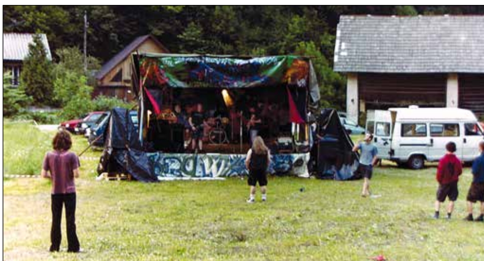
Krawal na travniku na jesenovcu.

Festival je bil na začetku načrtovan kot enodnevni, leta 1997 pa je prvič trajal dva dni. To je v naslednjih letih postalo že kar samoumevno. Danes je med stalnimi obiskovalci že znano, da dobiš, če festival obiščeš za en dan, na roko žig, če pa ga obiščeš za dva dni, ti pripada zapestnica.